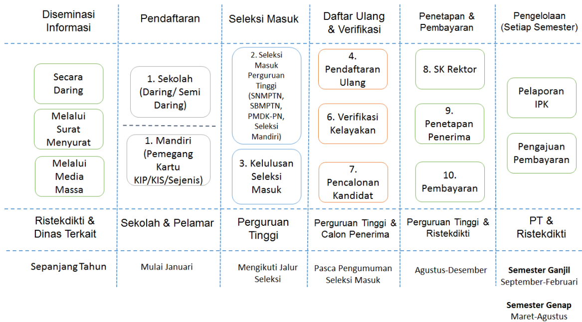
Gambar 1. Tahapan program Bidikmisi